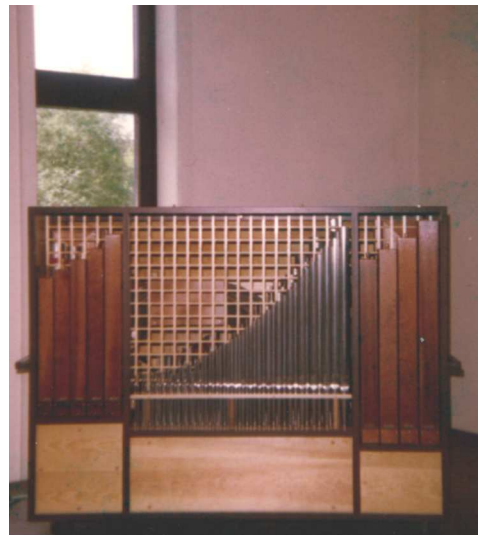
Orgel der Firma Peter, Baujahr 1979 im Gemeindehaus

Diese Investition wurde auf 250.000 Euro festgelegt und soll ausschließlich über Spenden finanziert werden.